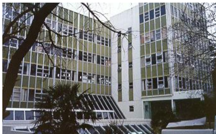
Universidad Nacional del Mar del Plata, sede del Congreso de Libre Pensadores de las Américas