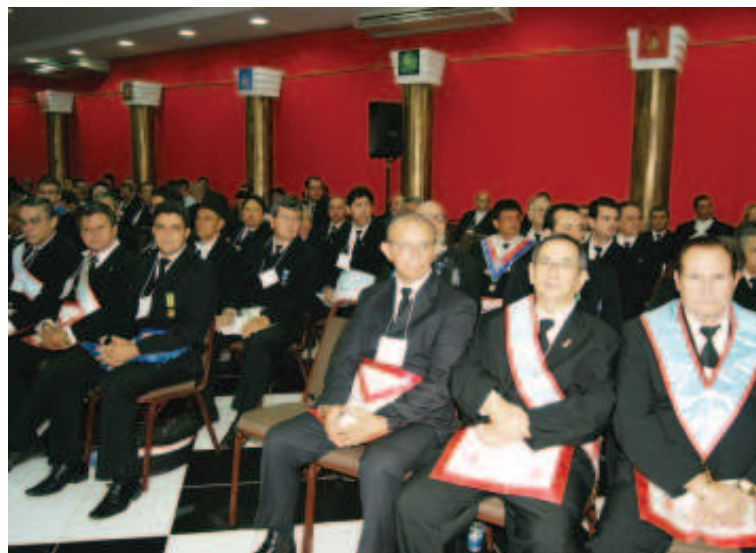
Vista parcial da Coluna do Norte do Templo lotado com a presença de Irmãos das três Potências Maçônicas da Maçonaria Unida de MT