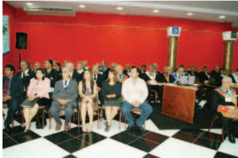
A palestra sobre o tema IGUALDADE foi aberta às cunhadas e familiares dos Irmãos das três Obediências da Maçonaria Unida de MT