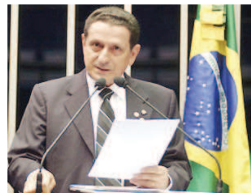
O senador, Irmão Mozarildo Cavalcanti (PTB/RR), presidiu a Sessão Especial do Senado, comemorativa ao Dia do Maçom

O Irmão Rubens Ricardo Franz observou que a Maçonaria estava representada na sessão do Senado pelas três grandes colunas e que para a COMAB, educação de qualidade e proatividade em questões sociais levarão o país a avançar em termos de inclusão social pelo conhecimento. O Irmão catarinense também defendeu um novo pacto federativo para redefinir as competências dos entes federativos com mais equilíbrio e justa distribuição dos recursos.