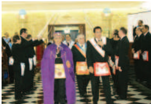
A recepção das Lojas às autoridades