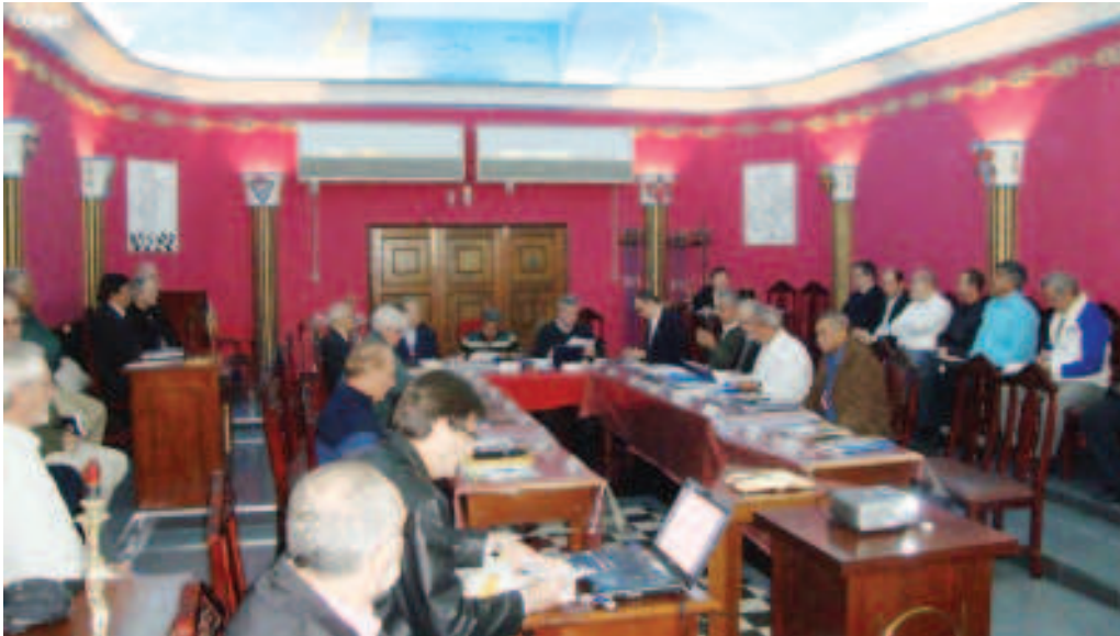
A 88ª Assembléia Geral Extraordinária (AGE) da COMAB foi realizada em São Paulo (SP)