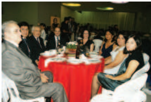
Irmãos do quadro da Loja e as cunhadas