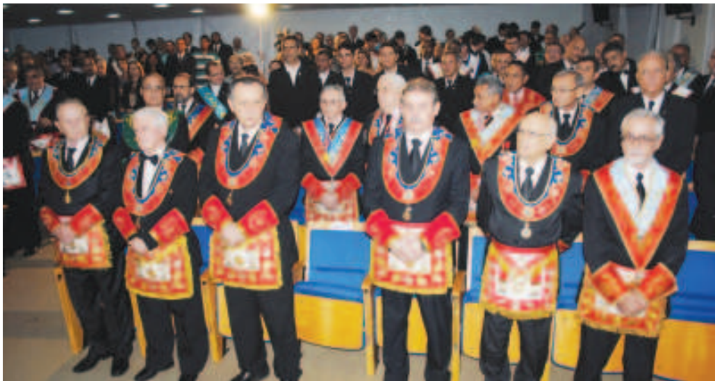
87ª Assembléia Geral da Confederação Maçônica do Brasil (COMAB), em João Pessoa (PB)

A posse da presidência e da nova diretoria da COMAB, contou com a presença de representantes de potências maçônicas de todos os estados brasileiros e também representantes de diversas lojas maçônicas do Grande Oriente Independente da Paraíba e da Assembléia Legislativa Maçônica.