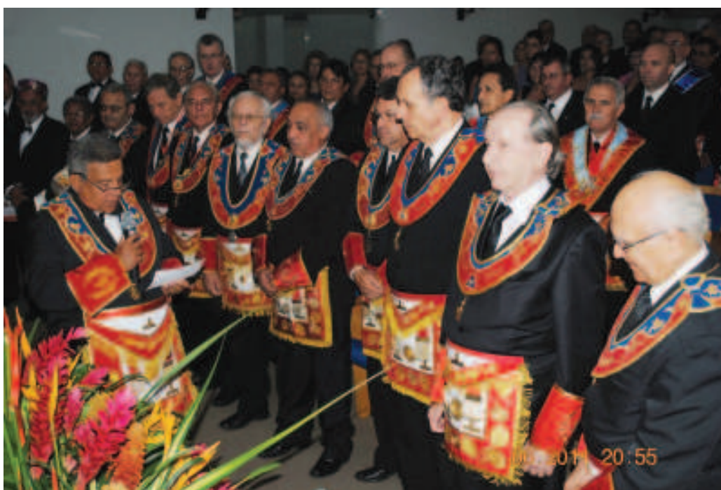
Sessão Magna de Posse da nova Diretoria da COMAB, em João Pessoa (PB). PÁGINAS 6 e 7