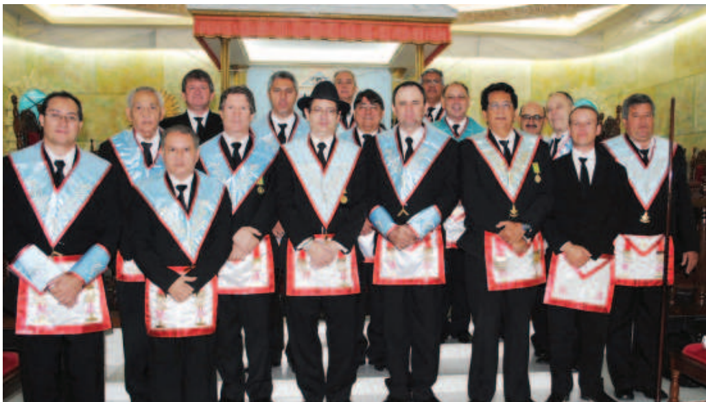
Instalação de Veneráveis Mestres em Barra do Garças, sede da 5ª Região Administrativa