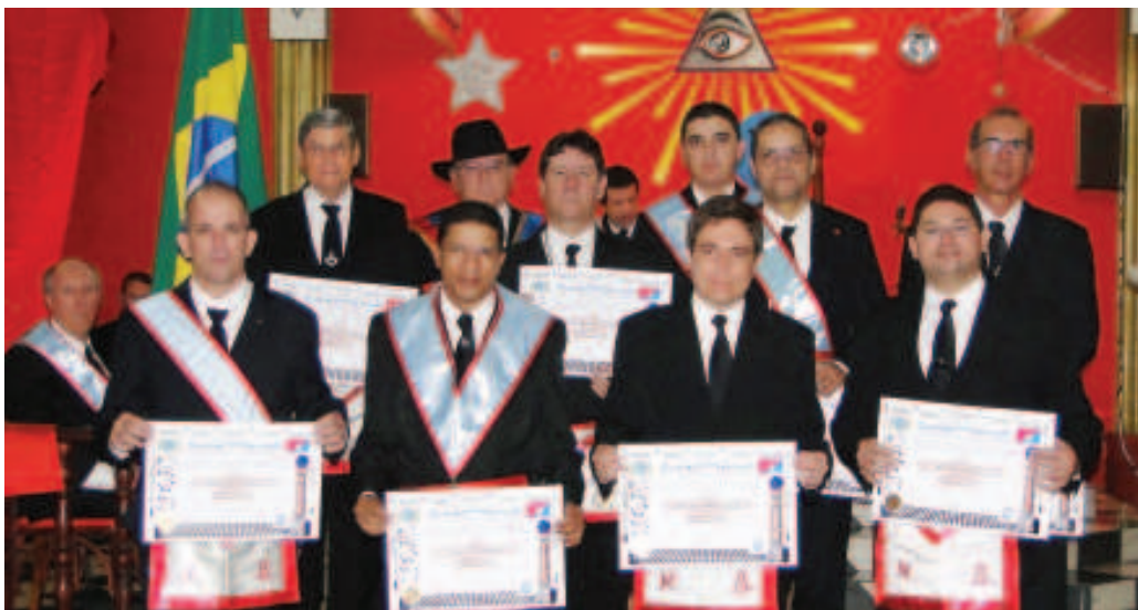
A Instalação de Veneráveis Mestres em Rondonópolis (3ª e 4ª Regiões Administrativas)