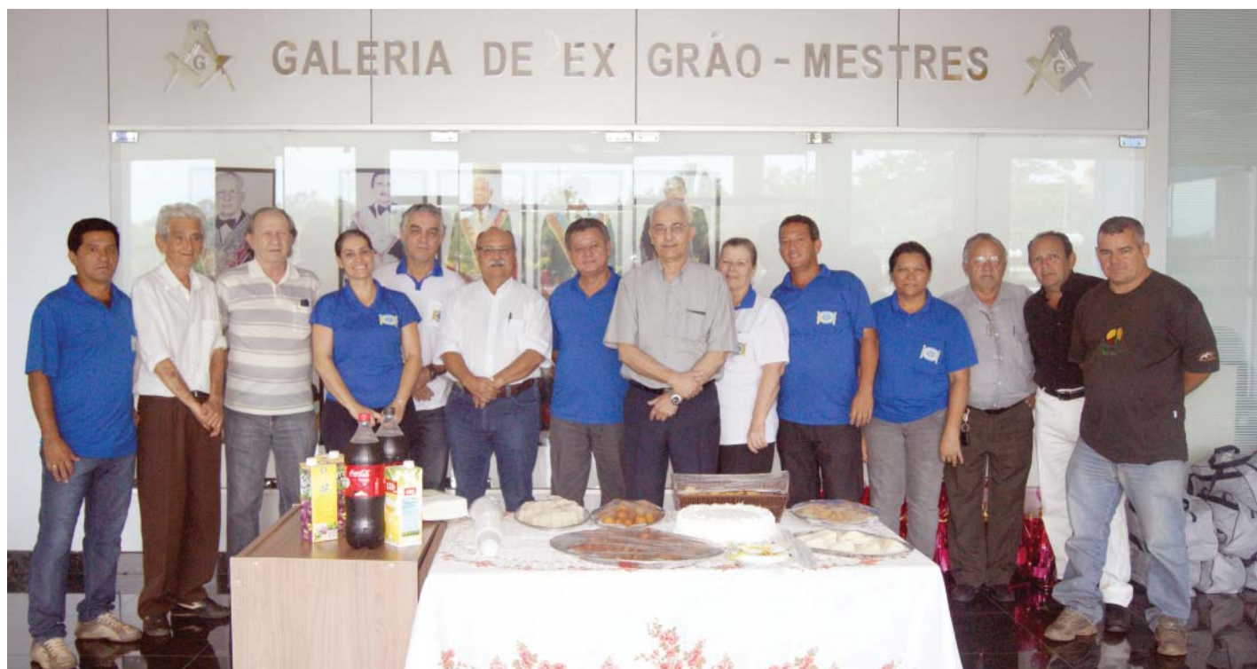
Grão-Mestre e parte da equipe de colaboradores da administração “Atitude Maçônica” e funcionários do Grande Oriente do Estado de MT