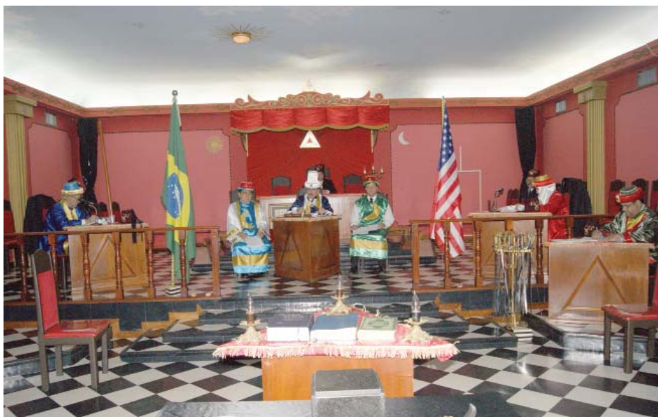
Última Sessão de Iniciação de Mestres Maçons realizada em Cuiabá, em 2012, no Templo da Loja Simbólica Acácia do Ocidente, jurisdicionada ao Grande Oriente do Estado de MT

29.05 – Noite: sessão conjunta de Lojas maçônicas das três Potências no Templo