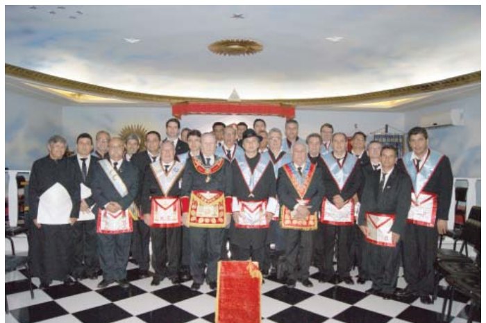
Quadro de Obreiros e convidados presentes na Sessão Econômica

ajude-me!” Uma voz grave e profunda, vinda dos céus, indagou: “o que você quer de mim, meu filho?” – Salve-me, meu Deus, por favor – respondeu.