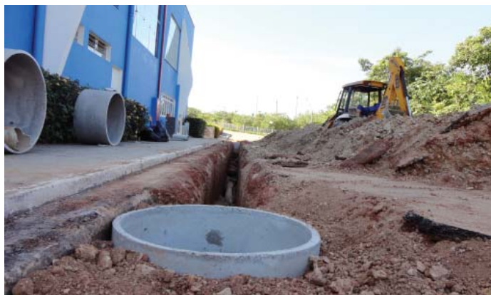
Rede de esgoto sanitário ligado ao sistema de esgotamento da CAB