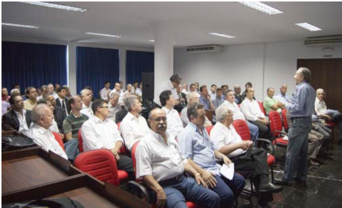
Forum Nacional da Confederação Maçônica, realizado em Cuiabá