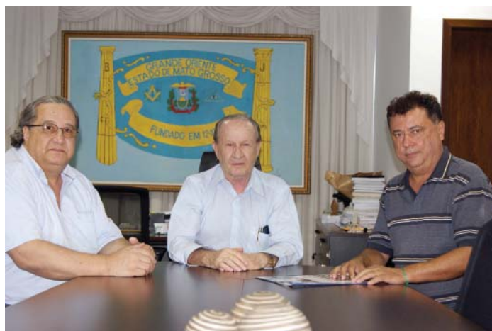
PRESTAÇÃO DE CONTAS GOEMT-MUTUA PERÍODO: 01 OUTUBRO A 31 DE DEZEMBRO DE 2012