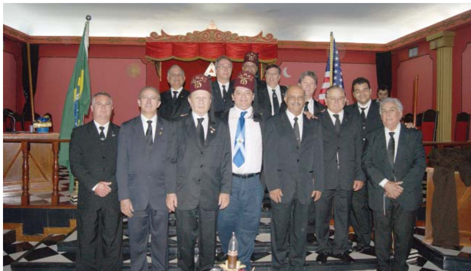
Foram iniciados 13 Mestres Maçons das Lojas Simbólicas jurisdicionadas ao Grande Oriente

01.06 – 08h00 às 11h00 – Atendimento aos Clubes Shriners e encerramento.