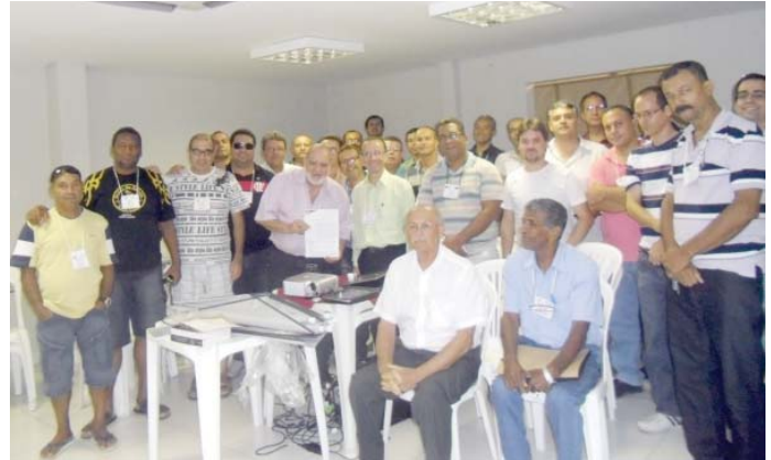
Curso de Mestre Maçom realizado com sucesso na capital baiana

as exigências do município. Instalação do para-raios, plantio de árvores em parceria com as Lojas Simbólicas na área de estacionamento, que recebeu demarcação para organizar horizontal e novo sistema de iluminação da área frontal do prédio.