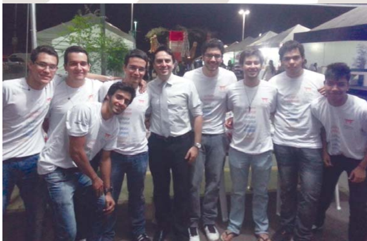
Grupo de DeMolays do Capítulo Acácia Cuiabana responsável pela arrecadação dos alimentos durante o “Festival do Japão”

Essa filantropia visou, principalmente, ajudar as pessoas carentes da periferia e da região ribeirinha, e teve uma grande receptividade por parte dos membros do Capítulo Juventude da Acácia Cuiabana que estão sempre a posto para praticar o bem ao próximo. “O evento foi, sem dúvida alguma, um sucesso no quesito organização, arrecadação e disposição dos voluntários. Esperamos ser convidados para outros eventos do mesmo cunho, porque no nosso Capítulo não negamos trabalho, suamos a camisa, carregamos peso se for preciso, pois temos o seguinte lema: Missão Dada é Missão Cumprida”, concluiu o Mestre Conselheiro.