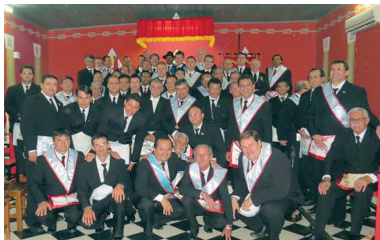
Quadro de irmãos presentes na Sessão Magna da Augusta e Respeitável Loja Simbólica União e Progresso, no Oriente de Rio Branco, MT