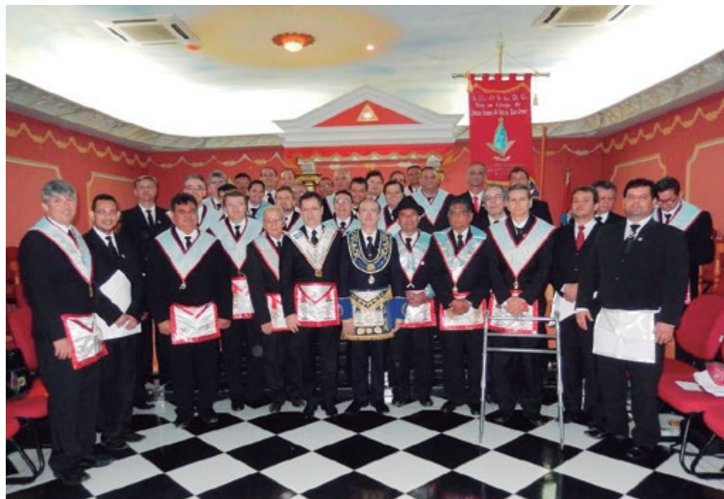
Registro dos irmãos presentes na Sessão Especial de 10 anos da Loja Simbólica União e Solidariedade