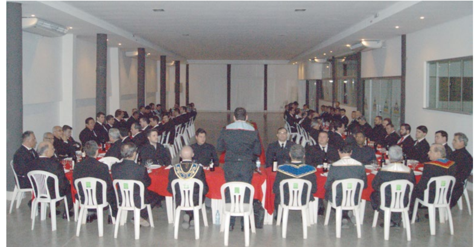
Cerca de 70 por cento dos maçons presentes no banquete que reuniu as Lojas do Complexo da Razão e Lealdade foi de jovens Aprendizes, Companheiros e Mestres

Quando assumimos, dizíamos que o Grande Oriente estava com seu quadro envelhecido, com pessoas na faixa etária muito alta. Levamos essa preocupação às Lojas jurisdicionadas, que passaram a investir na indicação de pessoas mais jovens.