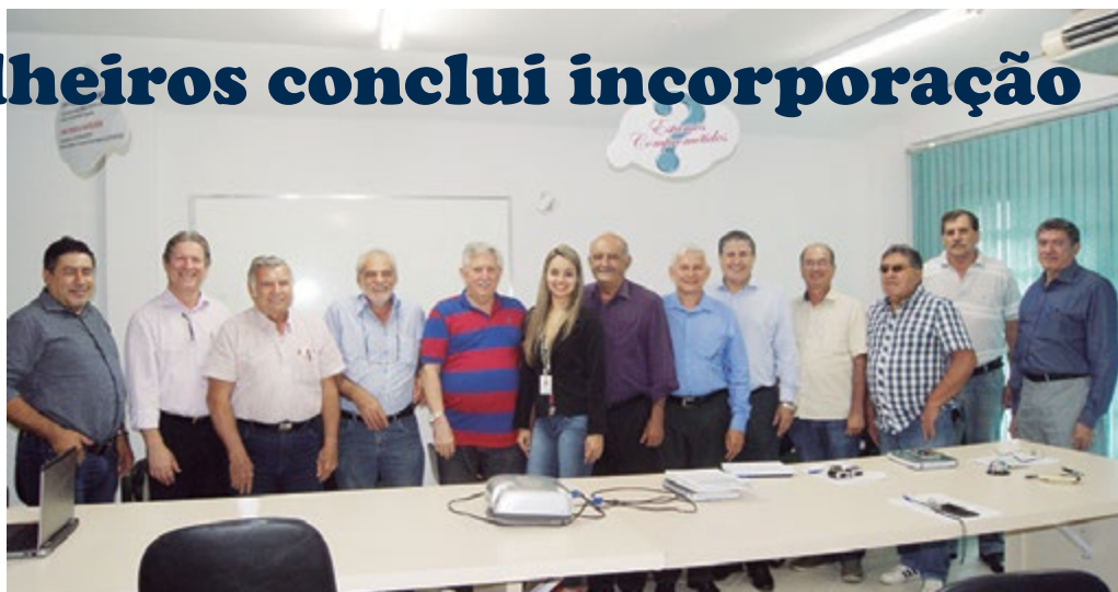
Conselho de Administração do Sicoob Integração reunido no dia 14 de janeiro de 2016 para posse de novos conselheiros

Na oportunidade, também foram empossados o novo diretor Administrativo,