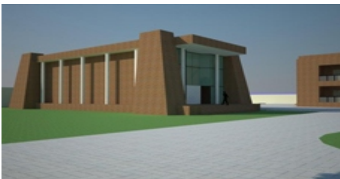
Projeto Arquitetônico do Novo Templo do Grau 33º

Em ato contínuo, após a fundação do novo Templo, a previsão é que se inicie as Obras dos Templos para cada Alto Corpo – Loja de Perfeição, Capítulo Rosa-Cruz, Conselho de Cavaleiros Kadosch e Consistório de Príncipes do Real Segredo – além de um Templo exclusivo para as Ordens Paramaçônicas – DeMolays, Filhas de Jó e Estrela do Oriente.