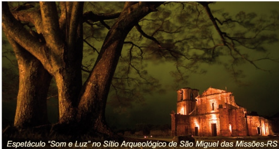
Espectáculo “Som e Luz” no Sítio Arqueológico de São Miguel das Missões-RS

No sábado, dia 27, às 09h, no Templo da Loja Simbólica “Luz da Colmeia nº 82”, localizada na Rua Cruz