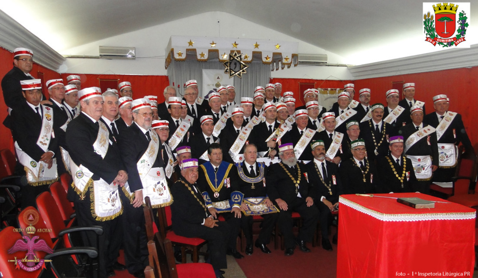
foto - 1ª Inspetoria Litúrgica PR