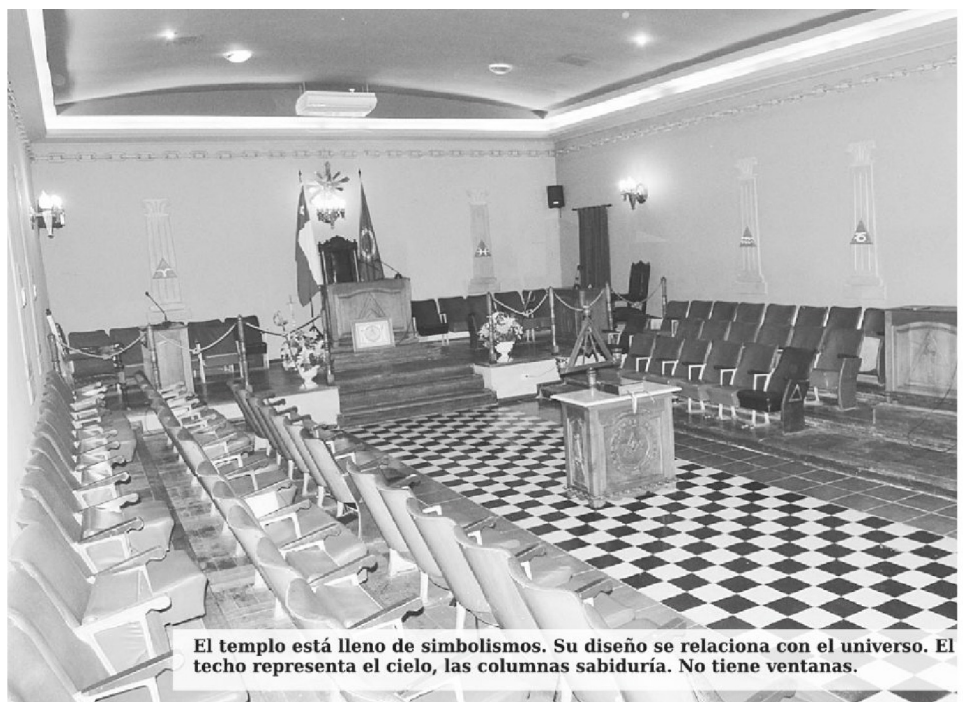
El templo está lleno de simbolismos. Su diseño se relaciona con el universo. El techo representa el cielo, las columnas sabiduría. No tiene ventanas.