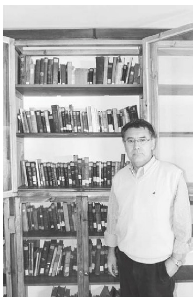
Valiosos ejemplares conforman la biblioteca. Ediciones en alemán y francés. Obras de destacados autores como Enrique Molina Garmendia, Tancredo Pinochet y Alejandro Venegas.