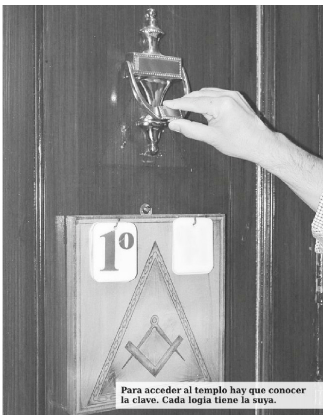
Para acceder al templo hay que conocer la clave. Cada logia tiene la suya.

El templo, el de las reuniones solemnes, es el corazón del edificio. Un pasillo flanqueado por sillones. A medio camino un atril con una Biblia, sí, una Biblia. Y al final del pasadizo más sillones y un proscenio destacado para el presidente de la logia.