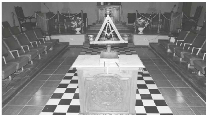
La escuadra y el compás dan cuenta de los orígenes de la masonería, de los constructores de iglesias, los primeros maestros.