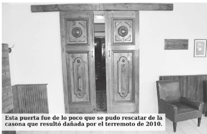
Esta puerta fue de lo poco que se pudo rescatar de la casona que resultó dañada por el terremoto de 2010.