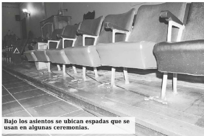
Bajo los asientos se ubican espadas que se usan en algunas ceremonias.