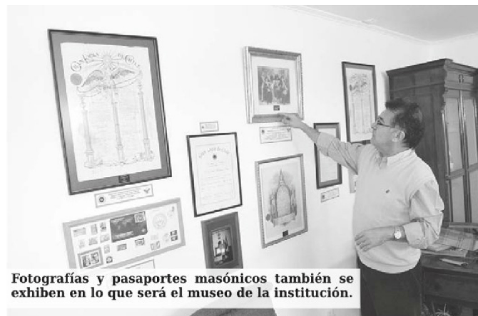
Fotografías y pasaportes masónicos también se exhiben en lo que será el museo de la institución.