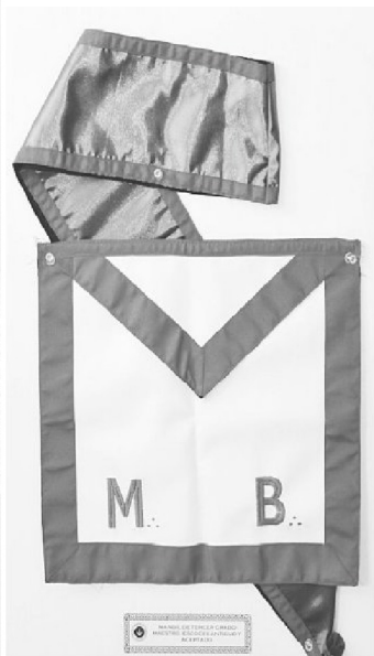
Son 33 los grados en que se divide el mundo masónico. Y cada uno tiene su mandil.