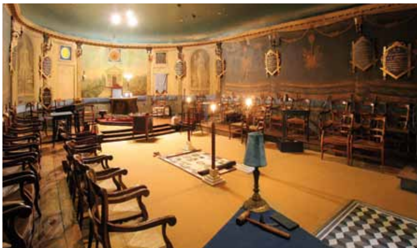
L'Accord Parfait - Grande Loge de France Création 1776 n°354 - Orient de Rochefort - 63 avenue Lafayette.

C'est en agissant avec intelligence, énergie et volonté que chacun se construit libre, responsable et respectueux de soi et des autres, et se met en position de contribuer à « l'émancipation progressive et pacifique de l'humanité ». Une invitation qui figure sous cette forme dans les textes de référence de la Grande Loge de France (Convent de Lausanne 1875).