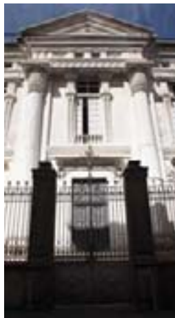
Exterior del Templo Masónico. JI. ADÁN

Además de conferencias y muestras, otras actividades serán la "cena ritualística para no iniciados" de mañana en el Casino