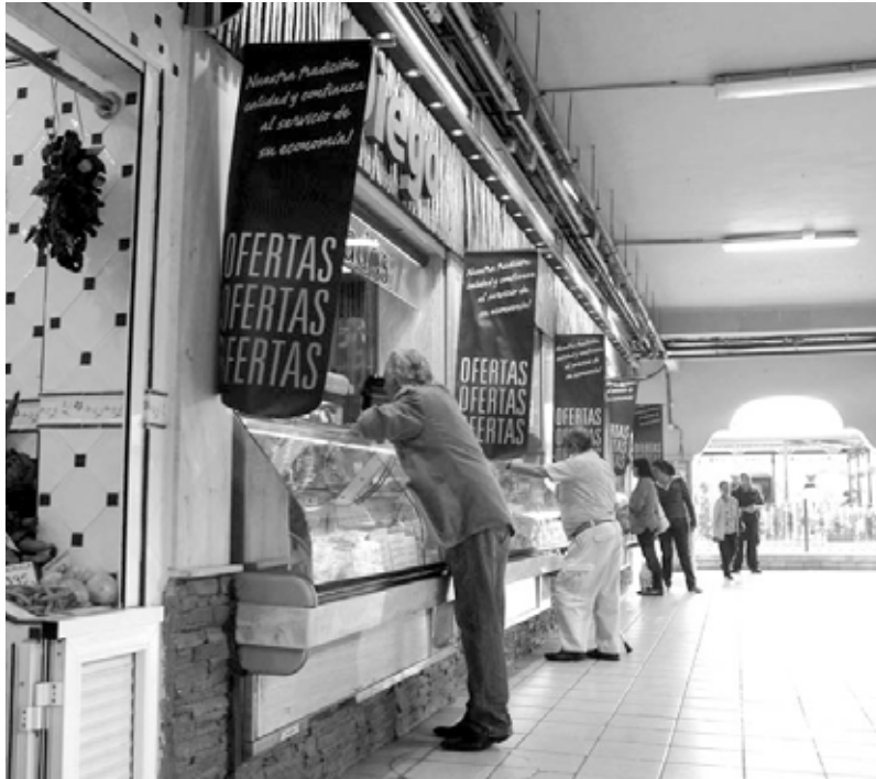
Varios locales comerciales del Mercado de África en la capital.

El edil santacrucero manifestó la voluntad del Consistorio para