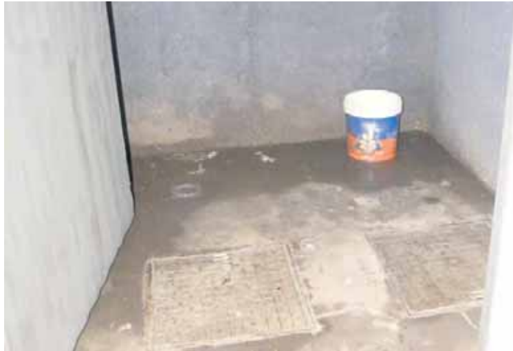
El mal sellado de una arqueta de aguas negras puede ser el origen de los malos olores del archivo.

Según consta en el parte presentado ante el área de Recursos Humanos del Ayuntamiento y del que también se ha dado traslado a la Dirección General de Trabajo, "una nueva potencial situación de peligro ha sobrevenido ante la falta de ventilación de una arqueta de aguas negras y su estación de bombeo, ubicadas en la planta -1 del edificio, junto a unas instalaciones sanitarias y el archivo general del centro de trabajo". El delegado de prevención refleja en la denuncia que, tras la visita realizada al lugar el pasado 20 de marzo, "pude constatar la evidencia de una más que probable concentración de gas metano (a la par que malos olores) en la zona del archivo, del que salí mareado tras permanecer tres minutos en su interior buscando rejillas de aireación y marcas de humedad".