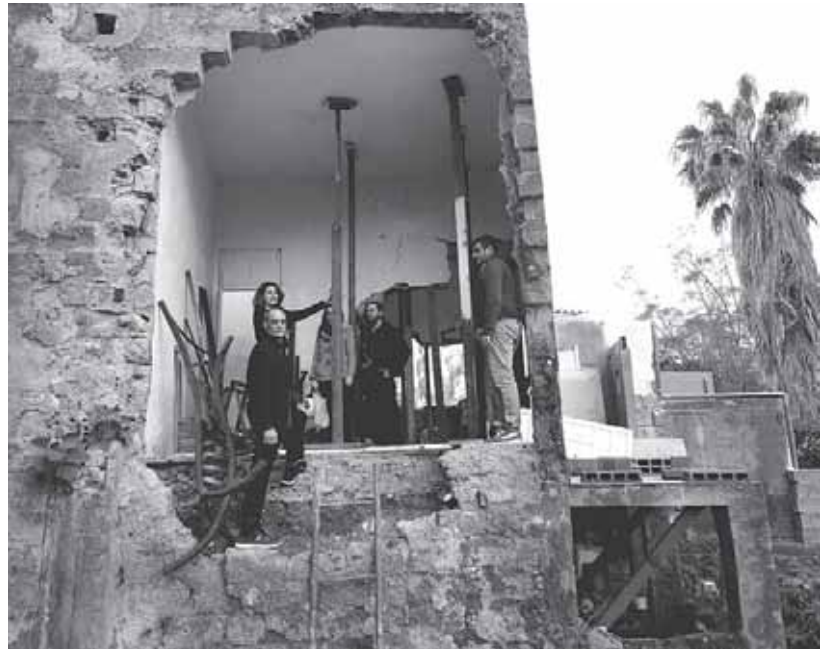
Los desperfectos de las lluvias arrasaron incluso casas como las del barrio de Buenavista en la capital.

El concejal aprovechó para cargar contra la candidata popular a la Alcaldía de Santa Cruz, Cris-