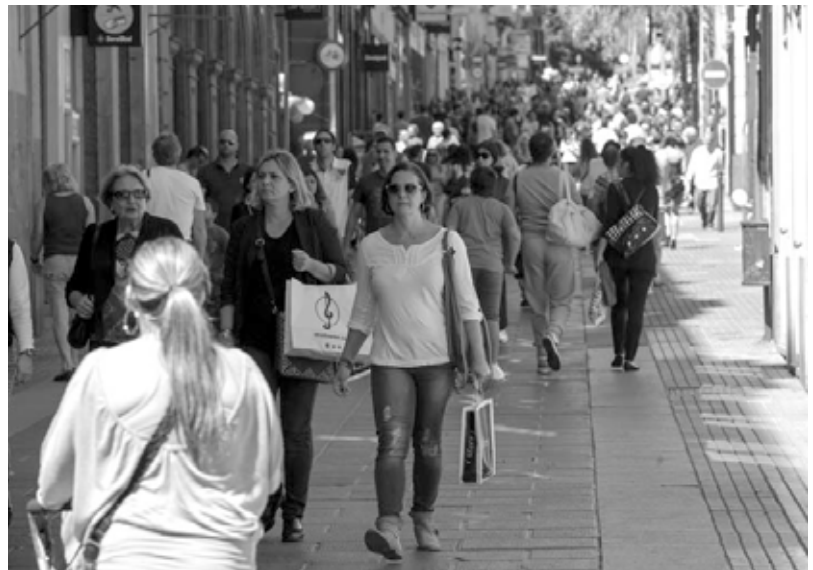
La calle Castillo durante un domingo comercial del año pasado.