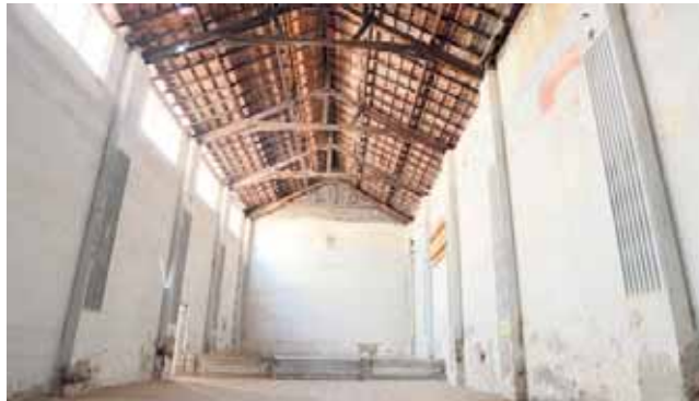
El Salón de los Pasos Perdidos es una de las estancias que se podrán visitar. / S.M.

El 23 de abril será el único día en el que se podrá ver el templo con una visita guiada