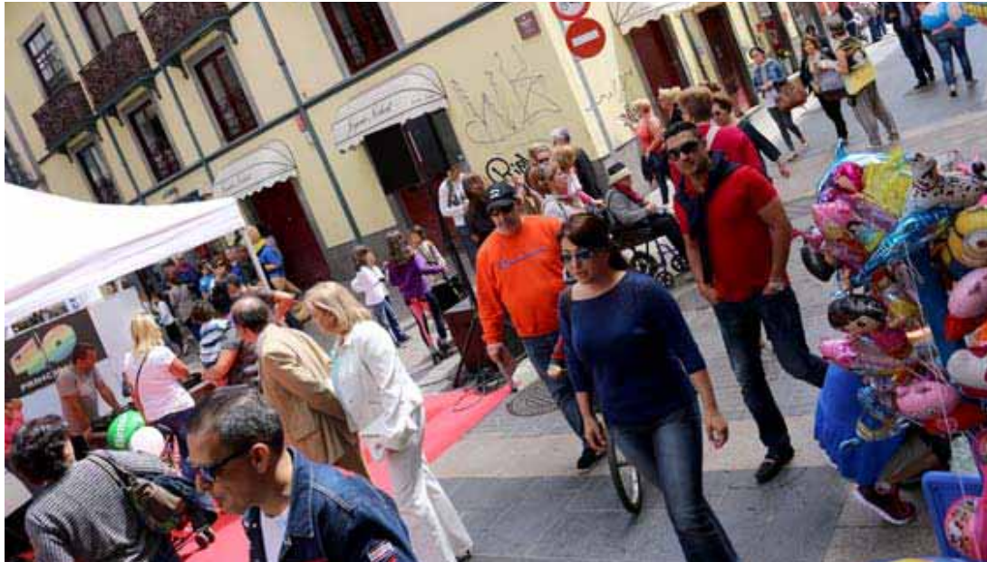
En esta primera edición de 2015, "Ven a Santa Cruz" se complementó con numerosas actividades de animación en vías comerciales, plazas y áreas de compras.