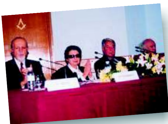
Το πάνελ της εκδηλώσεως.

Κατά την παρελθούσα εβδομάδα ανακοινώθηκε ότι οι πάγοι στην Ανταρκτική λειώνουν και πέντε κράτη διεκδικούν την εκμετάλλευσή του απελευθερωμένου χώρου, πράγμα ιδιαίτερα ανησυχητικό. Αυτή η προσπάθεια κινητοποιήσεως των συνειδήσεων στον Τεκτονικό χώρο έχει αρχίσει να εκδηλώνεται εδώ και πολύ χρόνο.