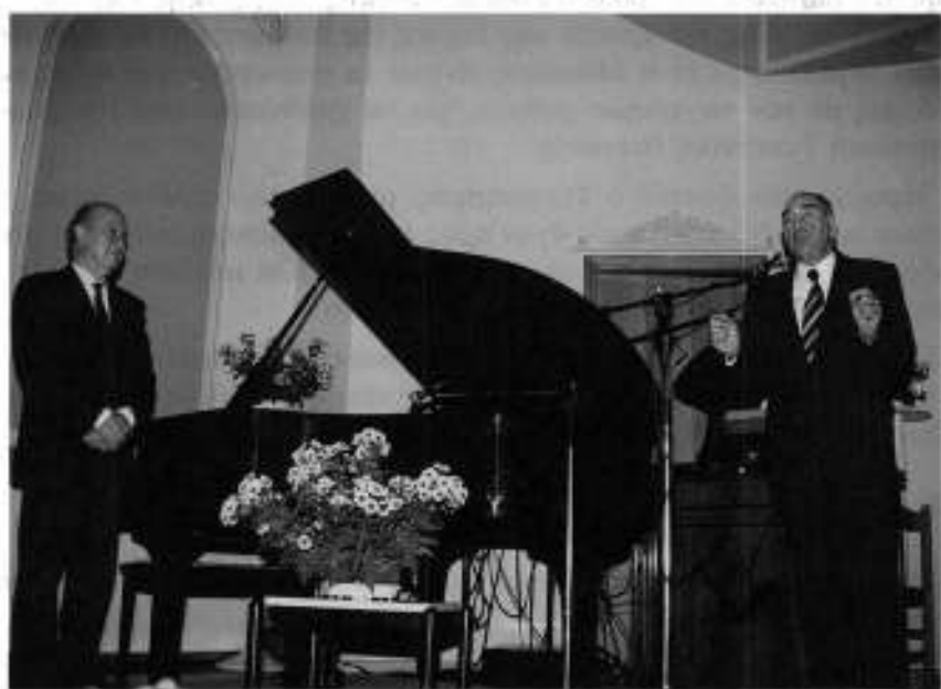
Ο Ενδ.: Μεγ.: Διδ.: της Μεγ.: Στοάς της Ελλάδος εκφράζων την ευγνωμοσύνη του προς τον συνθέτη Αδ.: Μίμη Πλέσσα για τη μελοποίηση του Ελληνικού Τεκτονικού Ύμνου «Προς το Φως».