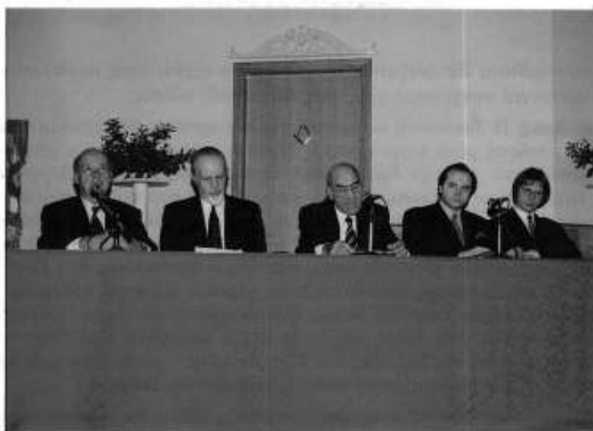
Ο Ενδοξ.: Μεγ.: Διδ.: της Μεγ.: Στοάς της Ελλάδος παρουσιάζει το προεδρείο της εκδήλωσης για το ρόλο της Μουσικής στην πολιτιστική ανάπτυξη.