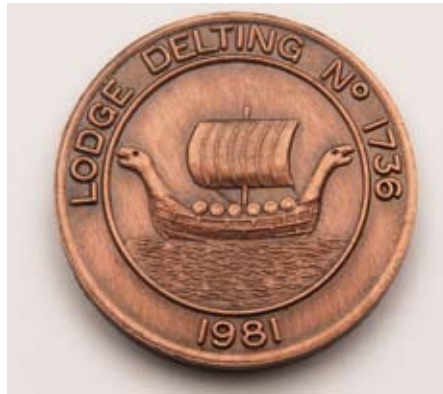
Minnispeningur frá stúkunni Delting nr. 1736 á Hjaltlandi.