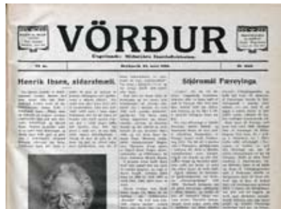
Blaðið Vörður 24. mars 1928