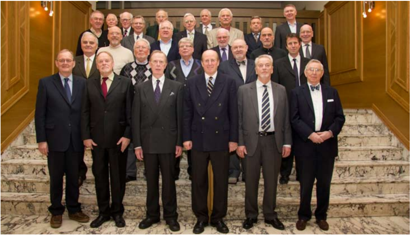
Stofnendur Fjölnefnis hittust í tilefni af 25 ára afmæli stúkunnar.