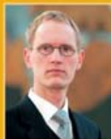
Frimann Andrésson útfaraþjónusta