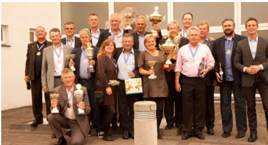
Stoltir verðlaunahafar úr hópi bræðra og systra.