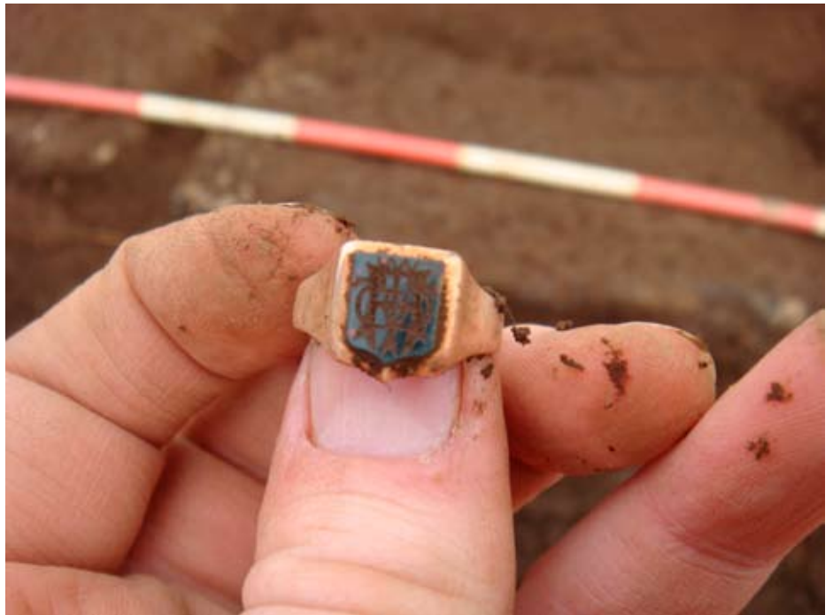
Innsiglihringur sem fannst á Þingvöllum.

Ljósmyndari Þjóðskjalasafnsins brást ljúflega við þeirri bön Frímúrarans að taka mynd af innsigliinu svo að