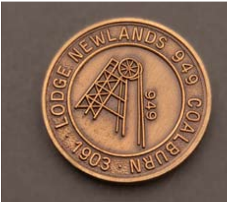
Stúkan Newlands nr. 949 Coalburn, Lanarkshire