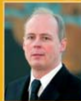
Ellert Ingason útfaraþjónusta