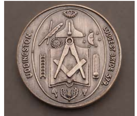
Stúkan Bryde nr. 579 í Uddings- ton, Lanarkshire