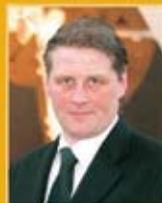
Svafar Magnússon útfaraþjónusta