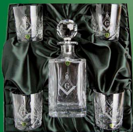
Karaffla með 4 glösum

Gjafavara - Gjafavara - Gjafavara - Gjafavara