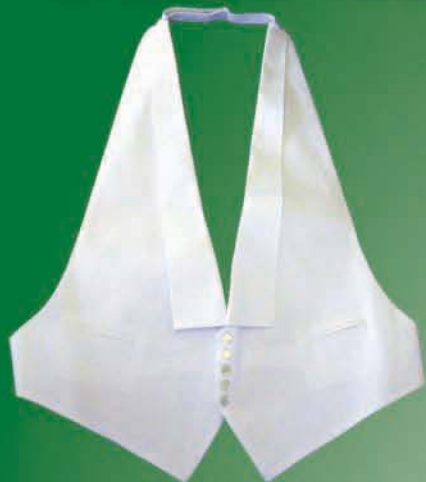
Hátíðavesti (5 hnappa)