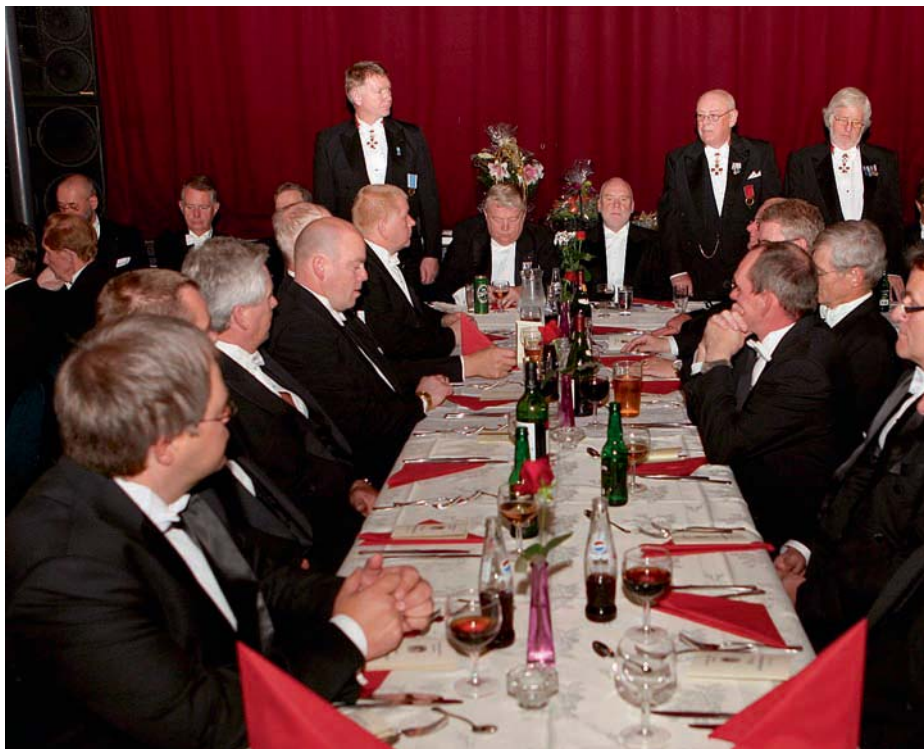
Frá bróðurmáltíð hátíðarfundarins.

bræður farið til móðurstúkunnar Rúnar á Akureyri til stigveitinga og þó að landleiðin hafi verið farin lengst af þá hafa þær ferðir oft verið mjög erfðar og stundum ævintýri líkastar.