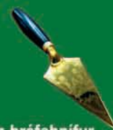
Múrskeld sem bréfahnifur