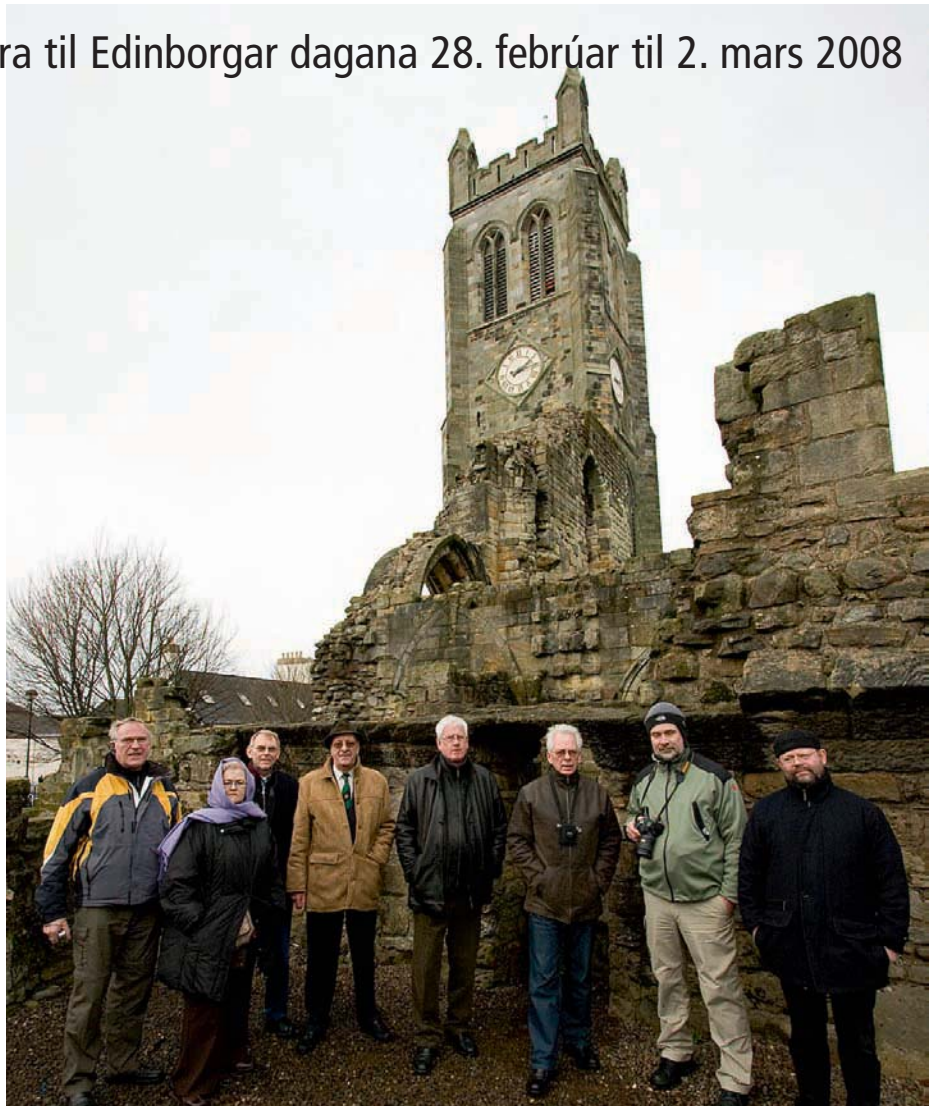
Um 100 manna hópur Hamarsbræðra og systra fór í Skotlandsferðina. Hér eru nokkur þeirra í skoðunarferð á frímúrararslóðum.

Fundurinn var haldinn í húsakynnum stúkunnar, Elgin House, húsnæði sem stendur við Easter Road númer 6 í Edinborg. Það er orðið nokkuð líúð enda búið að halda þar fundi í nokkra áratugi.