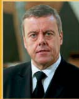
Þorsteinn Elísson útfararþjónusta