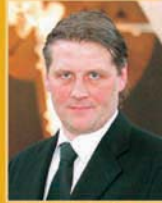
Svafar Magnússon útfararþjónusta