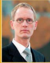
Frimann Andrésson útfararþjónusta