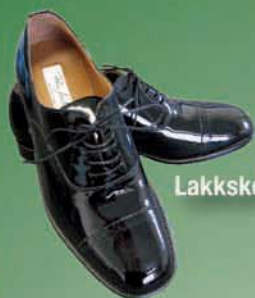
Lakkskór (ný tegund)