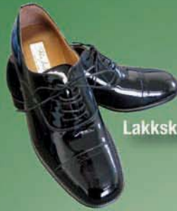
Lakkskór (ný tegund)