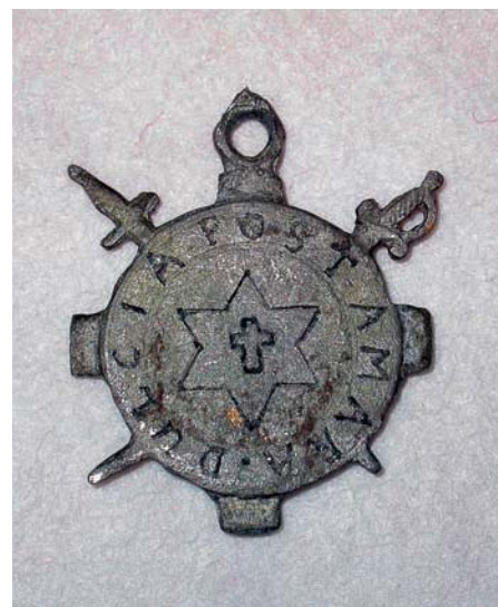
Fram- og bakhlið rússneska merkisins.

Eins og áður sagði endaði merkið í Minjasafni Reglunnar í Osló þar sem gefandinn hafði veitt athygli veglegu safni rússneskra frímúraragripa sem eru enn til sýnis í Minjasafninu í Osló. Þeir gripir fundust í leynihólf í skattholi sem rússneskur innflytjandi flutti með sér frá Rússlandi í lok fyrri heimsstyrjaldar. Forngripasali sem síðar hafði það í umboðssölu áttaði sig fljótlega á að líklega væri leynihólf í skattholinu sem seljandinn vissi ekki um. Hann leitaði og fann hólfíð og þar fundust rússnesku frímúrarargripirnir. Forngripasalinn, sem var frímúrararbróðir, fékk leyfi til að gefa gripina á Minjasafnið í Osló.