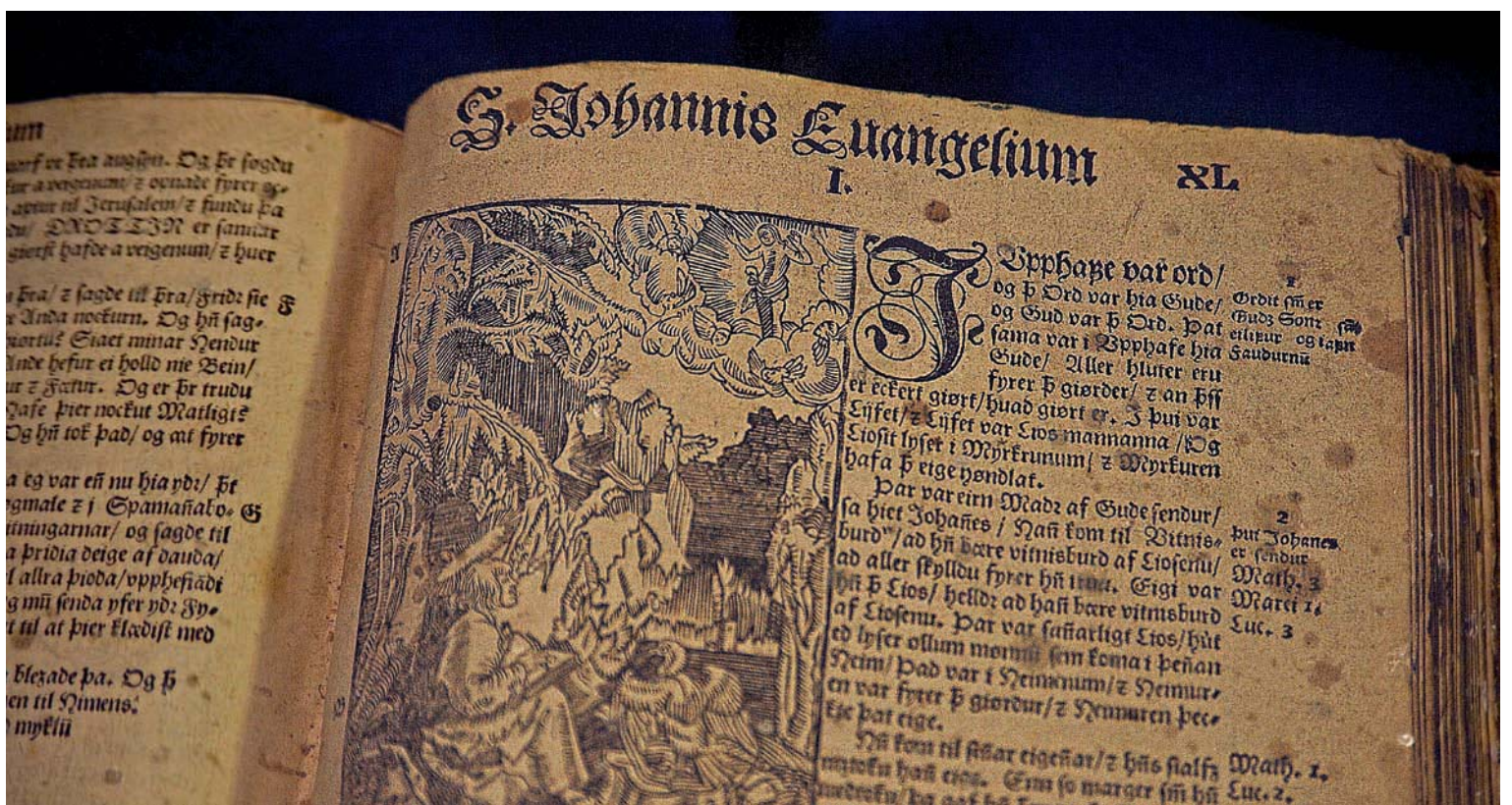
Upphaf Jóhannesarguðspjalls.

undirbúning útgefunnar notaði Guðbrandur eldri þýðingar eins og hægt var. Hann tók Nýja testamenti Odds Gottskálkssonar (1540) upp nálega óbreytt og hvað Gamla testamentið snerti notaði hann þýðingar Gissurar Einarssonar.