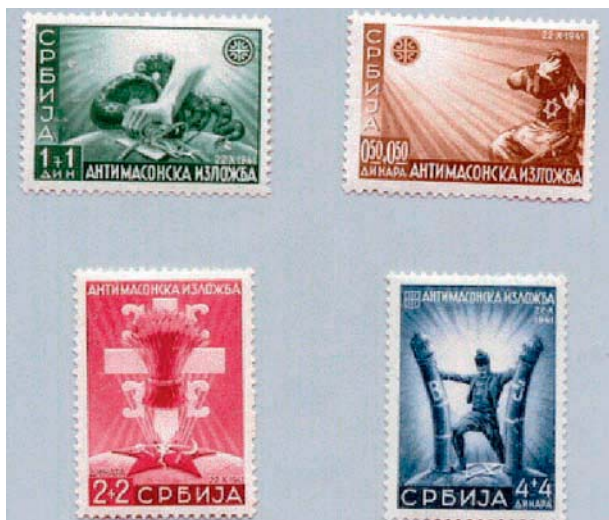
Áróðursfrímerki frá Serbíu gegn frímúrurum og gyðingum. Þessi frímerki voru hluti af áróðursherferð Serba sem hliðhollir voru setuliði nasista í Serbíu í seinni heimsstyrjöldinni.