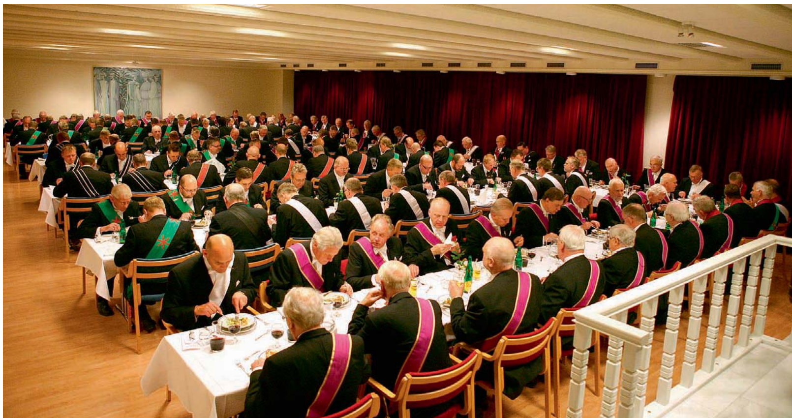
Sem sjá má var þétt setinn bekkurinn í veislustúkunni.