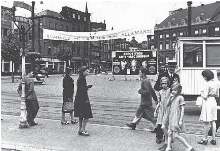
Undir hæl nasista var skipulagður áróður gegn frímúrurum. Hér er mynd frá Belgíu frá árinu 1941, þar sem auglýsing um sýningu sem átti að sanna samsæriskenningar nasista um Regluna sést fyrir framan frímúrarahúsið í Brussel.

Sem sagt frímúrarar hafa lengi mátt sitja undir ósanngjörnum og upplognum áróðri. En færri vita, að á sama tíma hefur frímúrarastarf styrkt stöðir þjóðfélaga, byggt upp einstaklinga, komið að og styrkt mörg góð málefni og þar með látið margt gott af sér leiða. Þrátt fyrir þessi jákvæðu ætlunarverk sín hafa frímúrarar þurft að heyja harða baráttu fyrir því að leiðrétta misskildar skoðanir um reglustarfið. Og það kom því ekki neinum á óvart þegar nasistar komust til valda í Pýskalandi, að sérstök fæð væri lögð á frímúrarastarfið, og það ekki eingöngu í Pýskalandi heldur og líka í öllum