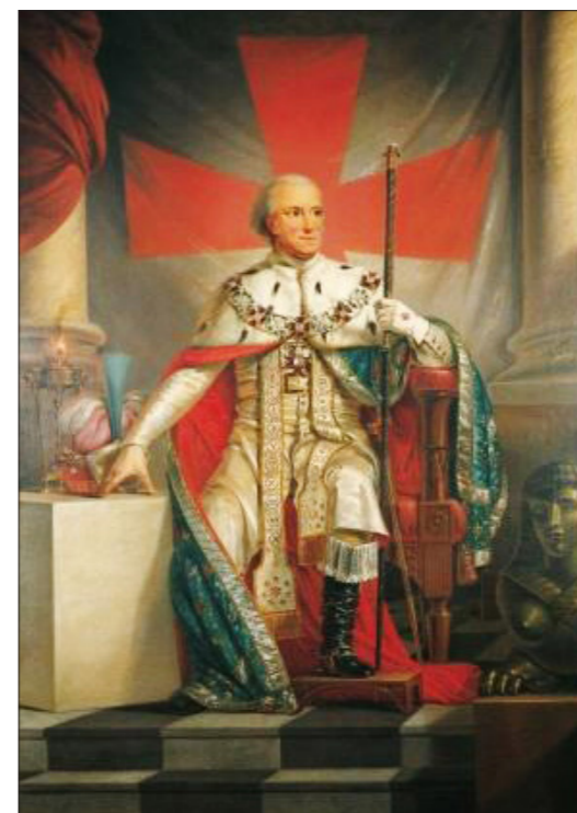
Hertug Carl av Södermanland