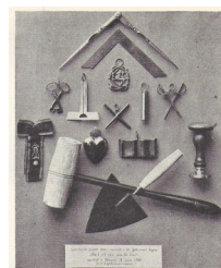
De fotograferte insignier. I logen beholdes ett Hammer, signet, nøkkel i kryds, 4 loge-merker og angrepsordenen med. Resten går bort ved innvielse, derskilt 8. logemøtet.

vi legge vekt på formidling og bruk av gode pedagogiske virkemidler. Blant annet skal det i 2013 også arrangeres et Forsknings symposium over samme lest som sist, med mange spennende og interessante temaer og foredragsholdere.