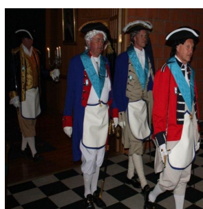
Brødrene fra Bergen viser det rektifiserte system anno 1809.

Den historiske logen i Bergen viste hvilket pedagogisk potensial slik loger har. Ved Forskningslogens Symposium 2011 ble det også