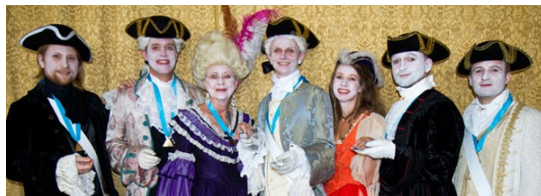
Deltagerne i et ritualskuespill med 1700-tallstema som ble fremført under Forsknings symposiet 2011.

direktorer med både historiske, samtidige og fremtidige spørsmål.