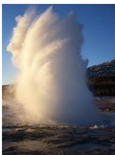
En geysir i full kraft fra dypet mot lyset!

Få med deg vår høytidsdag og dette spennende fordraget på vår høytidsdag 8. september 2012 i Stavanger.