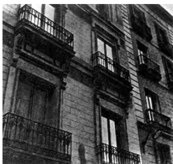
Primer local de la .I.L.E en Madrid, en la Calle Esparteros, núm. 9

son medidas de auténtico sabor institucionista. Cossío, desde la Dirección del Patronato de Misiones Pedagógicas, pone en marcha la creación de un teatro ambulante, dirigido por Marquina y después por Casona. Crea 5.000 bibliotecas en tres años y se realizan 44 «misiones» a las zonas más deprimidas de España.